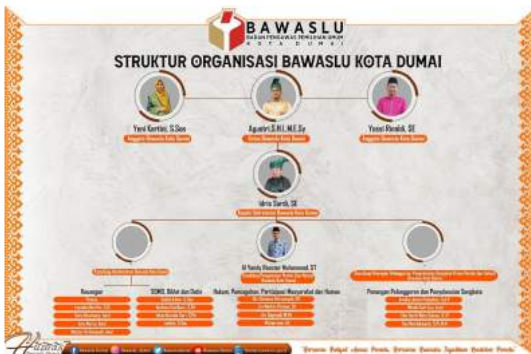
Bagan 1.2 Struktur Bawaslu Kota Dumai 2023-2028

Adapun Bagan Struktur Organisasi Sekretariat Bawaslu Kota Dumai Tahun 2023-2028 adalah sebagai berikut: